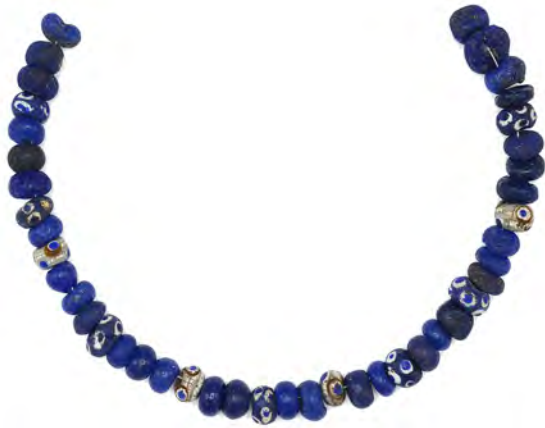
Collier de perles en verre 480-320 av. J.-C. Fessy, « chez Viret », tombe à crémation Coll. musée du Chablais – Ville de Thonon-les-Bains, inv. 2010.0.93, 2010.0.98

Le Chablais se distingue par la pratique concomitante de la crémation et de l'inhumation au V e siècle puis de l'inhumation seule aux IV e et III e siècles av. J.-C. Les défunts sont inhumés habillés, avec des accessoires vestimentaires (fibules, épingles, anneaux et agrafes de ceinture), des parures (bracelets, bagues, perles de verre). Les tombes masculines peuvent contenir une panoplie d'armements : fer de lance, épée et son fourreau avec les anneaux de suspension du baudrier. La tombe du guerrier de Vereître est évoquée au centre de l'espace d'exposition du musée.