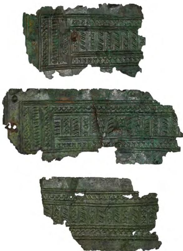
Plaque de ceinture 800 - 480 av. J.-C., bronze Gruffy, Le Molard Coll. Musée-Château d'Annecy, inv. 7755.1 à 3

Programmée sur deux saisons, l'exposition Avec armes et bagages. Les Celtes du Chablais offre aux visiteurs une belle visibilité des objets et des connaissances nouvelles de cette période qui précède la romanisation de notre région.