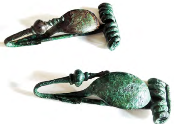
Fibules 400 – 320 av. J.-C., bronze Chens-sur-Léman, nécropole des Léchères Coll. musée du Chablais – Ville de Thonon-les-Bains. PCR : 74CHELE-37-147 et 148

La société des V e et III e siècles av. J.-C. est assez hiérarchisée. En atteste le haut degré de spécialisation nécessaire à la fabrication d'objets en fer et en bronze extrêmement ouvragés et d'une technicité difficilement reproductible par les artisans-forgerons d'aujourd'hui. La présence marquée d'hommes en armes au sein de cette population est en outre symptomatique d'une société où s'exercent des rapports de dominants à dominés.