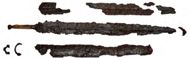
Epée et plaques de fourreau dissociées 400 – 260 av. J.-C., fer Allinges, nécropole d'Aviet Coll. musée du Chablais – Ville de Thonon-les-Bains, inv. 2010.0.105 et 106

La société des V e et III e siècles av. J.-C. est assez hiérarchisée. En atteste le haut degré de spécialisation nécessaire à la fabrication d'objets en fer et en bronze extrêmement ouvragés et d'une technicité difficilement reproductible par les artisans-forgerons d'aujourd'hui. La présence marquée d'hommes en armes au sein de cette population est en outre symptomatique d'une société où s'exercent des rapports de dominants à dominés.