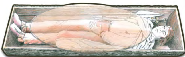
Hypothèse de restitution de la sépulture du guerrier de Vereître Auteur : Catherine Plantevin (Inrap)

Le Chablais se distingue par la pratique concomitante de la crémation et de l'inhumation au V e siècle puis de l'inhumation seule aux IV e et III e siècles av. J.-C. Les défunts sont inhumés habillés, avec des accessoires vestimentaires (fibules, épingles, anneaux et agrafes de ceinture), des parures (bracelets, bagues, perles de verre). Les tombes masculines peuvent contenir une panoplie d'armements : fer de lance, épée et son fourreau avec les anneaux de suspension du baudrier. La tombe du guerrier de Vereître est évoquée au centre de l'espace d'exposition du musée.