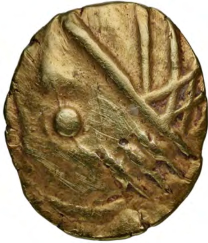
Monnaie en or anépigraphie 113 – 90 av. J.-C., or Lugrin, la Tour ronde Coll. Bibliothèque Nationale de France, inv. BnF/LT9270