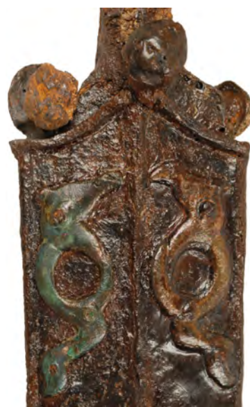
Fourreau de l'épée du guerrier de Vereître (détail des griffons) Vers 250 av. J.-C., fer et bronze Chens-sur-Léman, nécropole des Léchères Coll. musée du Chablais – Ville de Thonon-les-Bains, PCR : 74CHELE-01-08

Entre ornementation et code visuel, les motifs artistiques rencontrés en Chablais s'insèrent dans les styles dits « végétal » et « plastique » des IV e et III e siècles. La représentation des griffons, gardiens de l'arbre de vie qui accompagnent le guerrier, en est un des témoignages les plus exceptionnels.