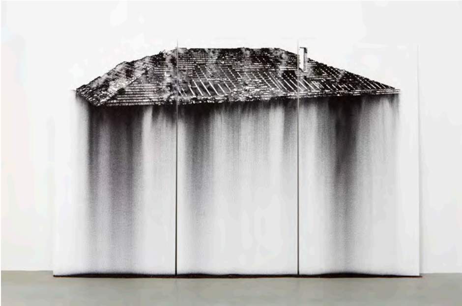
Nicolas Daubanes, Toit de la prison Charles-III, Nancy, 1972, 2017 , poudre d'acier aimanté, 2 x 3m - © Adagp, Paris, 2022