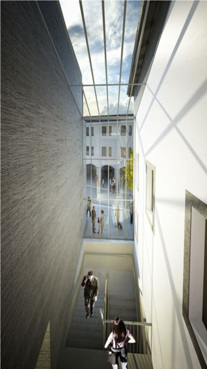
Perspective de la « faille » : raccordement entre l'extension contemporaine (à gauche) et la partie ancienne (à droite), vue depuis l'intérieur de l'ouvrage avec au fond la rue des Granges.

La Commune a souhaité qu'elle ne soit pas trop importante afin de maintenir l'alignement entre le bâtiment existant et l'extension. La transparence maîtrisée de la faille permet de lire le bâtiment existant dans son volume original depuis la rue des Granges et d'apporter de la lumière naturelle dans l'escalier et au sous-sol.