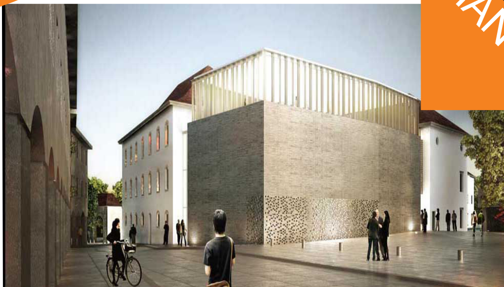
Perspective de l'extension (Auditorium) depuis la rue des Granges.