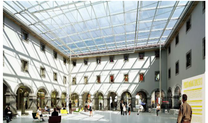
Vue du cloître avec la verrière : l'Espace Forum

Ce nouveau lieu, bien que connecté en de multiples points aux différents services qui l'innervent, demeure singulier, conserve son unité et le principe de circulation du cloître par sa périphérie.