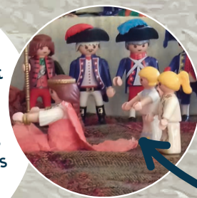
Le Sacre de Napoléon , de Jacques-Louis David réinterprété avec des Playmobil®

Amusez-vous à réinterpréter une œuvre d'art de l'époque 1789-1815 avec des Lego®, des Playmobil® ou en vous mettant en scène dans des décors de votre choix