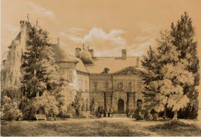
Henri-John TERRY (auteur), Davis Alois SCHMID (lithographe), Château de Coppet , 1842, lithographie, coll. cabinet d'arts graphiques MAH, Genève

La Côte désigne la région entre Lausanne et Genève, depuis les rives du lac jusqu'aux crêtes du Jura. Le long de la rive droite du Léman se déroule un axe commercial historique qui a entraîné le développement de nombreuses communes et châteaux. Celui de Coppet devient un foyer intellectuel reconnu où les penseurs de l'époque se réunissent autour de Germaine de Staël.