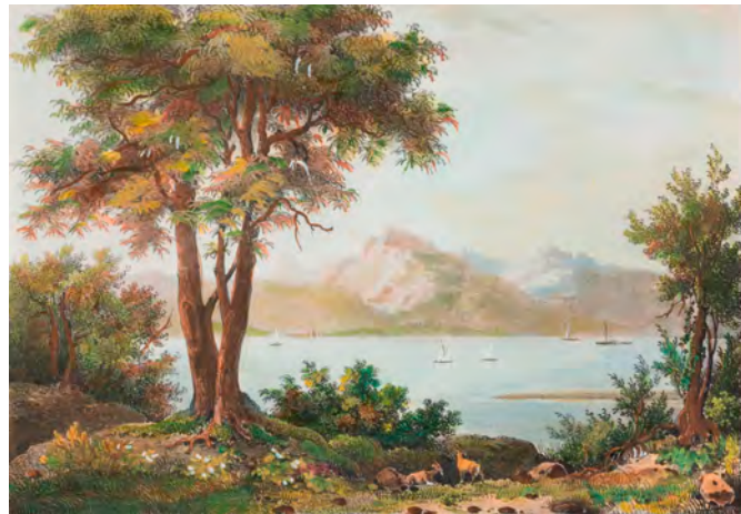
Hippolyte VANDER-BURCH (auteur), Rose Joseph LEMERCIER (lithographe), BULLA (éditeur), Entrée du Rhône et fin du lac de Genève , 1829, lithographie aquarellée, coll. musée du Chablais, Thonon

La première partie de l'exposition s'attache à l'extrémité du Léman portant le nom de Chablais, dont l'étymologie pourrait venir du latin Caput Lacis signifiant « tête du lac ». La région de Villeneuve est le débouché de la haute vallée du Rhône, axe de communication important. Ainsi, l'activité des barques à voiles latines et des « bacounis » est très présente dans ces œuvres.