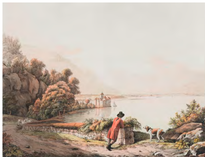
Jean Daniel HUBER (auteur), Christian VON MECHEL (graveur), Vue du château de Chillon , vers 1790, eau-forte aquarellée, coll. musée du Chablais, Thonon

L'exposition évoque également la figure de Lord Byron qui connaît une renommée internationale avec Le prisonnier de Chillon .