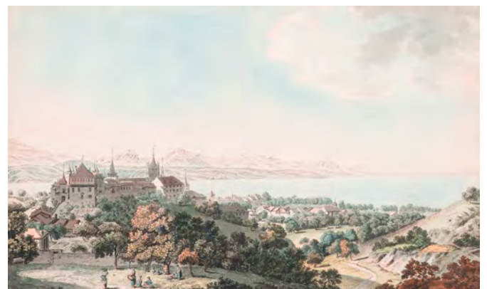
Johann Ludwig ABERLI (auteur), Balthasar Anton DUNKER (graveur), Vue de Lausanne , 4 e quart du XVIII e siècle, eau-forte aquarellée, coll. cabinet d'arts graphiques MAH, Genève

L'évolution urbanistique de Lausanne se dessine à travers le regard des artistes sur la ville. Si au XVIII e siècle, ces derniers prennent volontiers de la hauteur pour embrasser un paysage large, le point de vue se resserre tout au long du XIX e siècle sur certains quartiers et les bords du Léman avec notamment l'aménagement du port d'Ouchy.