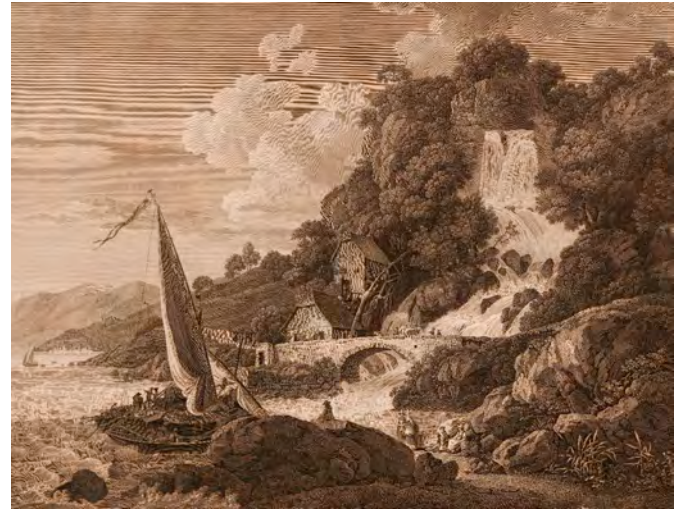
Louis-Albert-Guillain BACLER D'ALBE (auteur), Benjamin Rodolphe COMTE (graveur), Vue de la cascade de Saint-Saphorin sur le lac de Genève , 1794, eau-forte et burin, coll. cabinet d'arts graphiques MAH, Genève

La cascade du Forestay constitue en revanche un point d'attraction pour les voyageurs en quête de beaux paysages mais aussi de sensations fortes.