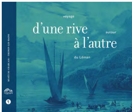
D'une rive à l'autre, voyage autour du Léman Éditions Libel, Lyon. 96 pages, 21 cm x 25 cm Prix de vente public : 13 euros

En 2017, un catalogue du second type a été édité, embrassant les deux actes de l'exposition D'une rive à l'autre, voyage autour du Léman . Il s'agit d'une forme moderne des ouvrages et récits de voyage des XVIII e et XIX e siècles. Largement illustré par les œuvres exposées, il regroupe l'ensemble des deux parties de l'exposition selon une approche thématique plutôt que géographique. Il comprend trois essais sur l'exposition et les voyages autour du Léman, rédigés par les commissaires de l'exposition.