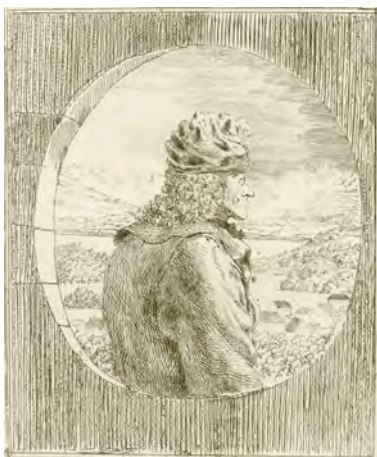
Jean HUBER, Portrait de Voltaire à Ferney, 1759-1786, eau-forte, coll. cabinet d'arts graphiques MAH, Genève

L'histoire de Ferney est indissociable de celle de son « patriarche ». Avec l'installation de Voltaire en exil, le bourg est métamorphosé, à l'image du château qu'il reconstruit. Au cours des vingt dernières années de sa vie, Voltaire devient « l'aubergiste de l'Europe » et mène son combat pour la tolérance, la liberté et la justice.