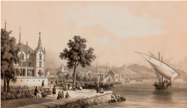
Isidore DERROY (lithographe), LEMERCIER (imprimeur), Vevey, 1 ère moitié XIX e siècle, lithographie au crayon, coll. cabinet d'arts graphiques MAH, Genève

La Riviera vaudoise est une baie protégée du Léman. De quoi séduire dès la fin du XVIII e siècle, la bonne société qui se retrouve sur les promenades nouvellement créées au bord du lac. La région de Vevey devient également le lieu d'un pèlerinage sur les traces de Julie et Saint-Preux, héros de la Nouvelle Héloïse de Jean-Jacques Rousseau, grand succès littéraire dès sa publication.