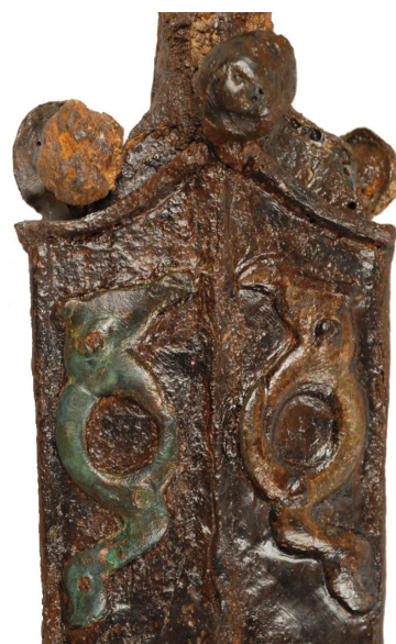
Fourreau de l'épée du guerrier de Vereître (détail des griffons) Vers 250 av. J.-C., fer et bronze Chens-sur-Léman, nécropole des Léchères Coll. musée du Chablais – Ville de Thonon-les-Bains, PCR : 74CHELE-01-08

Entre ornementation et code visuel, les motifs artistiques rencontrés en Chablais s'insèrent dans les styles dits « végétal » et « plastique » des IV e et III e siècles. La représentation des griffons, gardiens de l'arbre de vie qui accompagnent le guerrier, en est un des témoignages les plus exceptionnels.