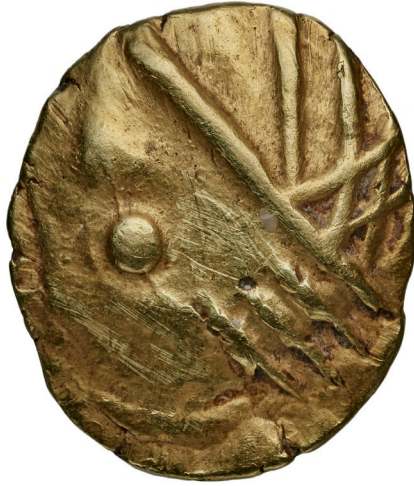
Monnaie en or anépigraphie 113 – 90 av. J.-C., or Lugrin, la Tour ronde Coll. Bibliothèque Nationale de France, inv. BnF/LT9270