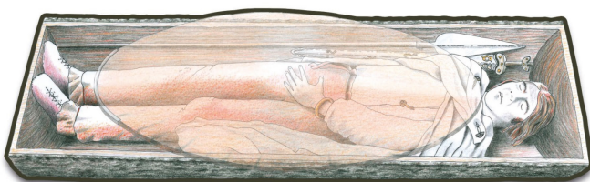
Hypothèse de restitution de la sépulture du guerrier de Vereître Auteur : Catherine Plantevin (Inrap)

Le Chablais se distingue par la pratique concomitante de la crémation et de l'inhumation au V e siècle puis de l'inhumation seule aux IV e et III e siècles av. J.-C. Les défunts sont inhumés habillés, avec des accessoires vestimentaires (fibules, épingles, anneaux et agrafes de ceinture), des parures (bracelets, bagues, perles de verre). Les tombes masculines peuvent contenir une panoplie d'armements : fer de lance, épée et son fourreau avec les anneaux de suspension du baudrier. La tombe du guerrier de Vereître est évoquée au centre de l'espace d'exposition du musée.