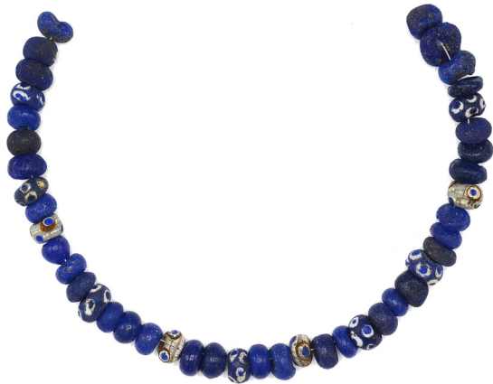
Collier de perles en verre 480-320 av. J.-C. Fessy, « chez Viret », tombe à crémation Coll. musée du Chablais – Ville de Thonon-les-Bains, inv. 2010.0.93, 2010.0.98

Le Chablais se distingue par la pratique concomitante de la crémation et de l'inhumation au V e siècle puis de l'inhumation seule aux IV e et III e siècles av. J.-C. Les défunts sont inhumés habillés, avec des accessoires vestimentaires (fibules, épingles, anneaux et agrafes de ceinture), des parures (bracelets, bagues, perles de verre). Les tombes masculines peuvent contenir une panoplie d'armements : fer de lance, épée et son fourreau avec les anneaux de suspension du baudrier. La tombe du guerrier de Vereître est évoquée au centre de l'espace d'exposition du musée.