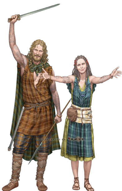
Reconstitution de costumes typiques du Chablais dans les années 320 av. J.-C. Auteur : aRU-MOR