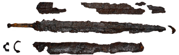
Epée et plaques de fourreau dissociées 400 – 260 av. J.-C., fer Allinges, nécropole d'Aviet Coll. musée du Chablais – Ville de Thonon-les-Bains, inv. 2010.0.105 et 106

La société des V e et III e siècles av. J.-C. est assez hiérarchisée. En atteste le haut degré de spécialisation nécessaire à la fabrication d'objets en fer et en bronze extrêmement ouvragés et d'une technicité difficilement reproductible par les artisans-forgerons d'aujourd'hui. La présence marquée d'hommes en armes au sein de cette population est en outre symptomatique d'une société où s'exercent des rapports de dominants à dominés.