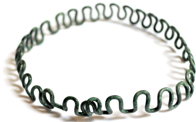
Bracelet à méandres 400-320 av. J.-C., bronze Chens-sur-Léman, nécropole des Léchères Coll. musée du Chablais – Ville de Thonon-les-Bains, PCR : 74CHELE-70-267