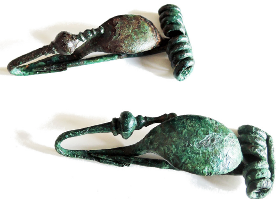
Fibules 400 – 320 av. J.-C., bronze Chens-sur-Léman, nécropole des Léchères Coll. musée du Chablais – Ville de Thonon-les-Bains. PCR : 74CHELE-37-147 et 148

La société des V e et III e siècles av. J.-C. est assez hiérarchisée. En atteste le haut degré de spécialisation nécessaire à la fabrication d'objets en fer et en bronze extrêmement ouvragés et d'une technicité difficilement reproductible par les artisans-forgerons d'aujourd'hui. La présence marquée d'hommes en armes au sein de cette population est en outre symptomatique d'une société où s'exercent des rapports de dominants à dominés.