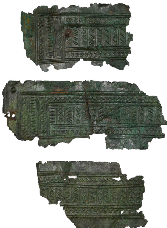
Plaque de ceinture 800 - 480 av. J.-C., bronze Gruffy, Le Molard Coll. Musée-Château d'Annecy, inv. 7755.1 à 3

Programmée sur deux saisons, l'exposition Avec armes et bagages. Les Celtes du Chablais offre aux visiteurs une belle visibilité des objets et des connaissances nouvelles de cette période qui précède la romanisation de notre région.